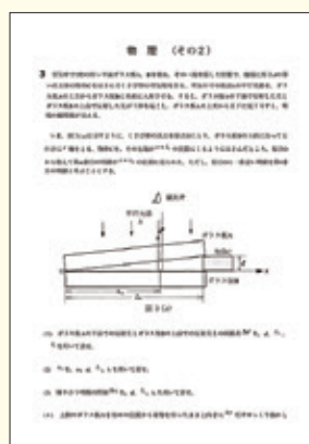
2022 ウインドラム昭和実戦模試